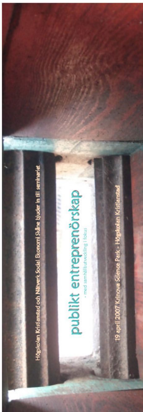
Inbjudningar till Nätverkets seminarier

På nätverkets nya hemsida www.socialekonomiskane.se kommer bl.a. rapporterna, information och nyheter att vara tillgängliga för alla som är intresserade av och vill informera sig kring den sociala ekonomins verksamhet för bl. a. tillgänglighet och mångfald i Skåne. Detta är en bra utgångspunkt för projektets fortlevnad och för en fortsatt och fördjupad dialog.